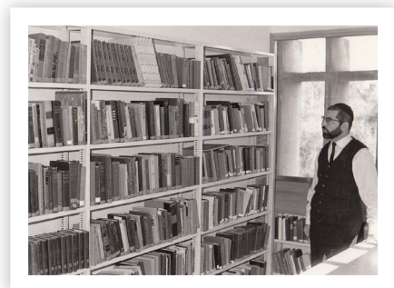
רב מאיר וונדר בצעירותו

הרבי, בראייתו הרחבה, העלה רעיון מקורי והסב את תשומת לבנו לנקודה שכלל לא נתנו עליה את הדעת. אנחנו בארץ הסתכלנו בעיקר על המעגל המצומצם המקומי של דוברי עברית, אבל הרבי